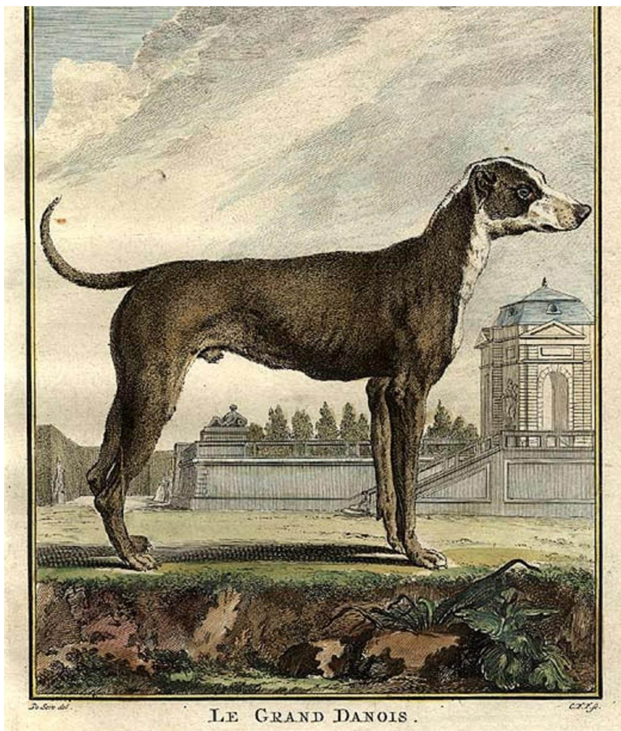
Duitse dog 18 e eeuw (Buffon)