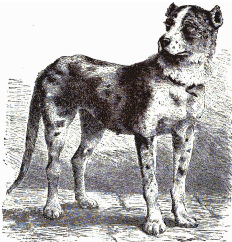
THE DANISH DOG. —One of the noblest of Dogs, and the handsomest of the Mastiff group, is the Danish Dog. The long legs give it great running ability, and the strong body and limbs confer upon the animal great powers of endurance, while the eyes speak kindness and intelligence. ( Canis familiaris molossus danicus. )