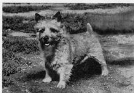
ENG. AND AM. CH. WHINLATTER ALLERCOMBE HIKER Top winning Norwich Terrier Sire of champions