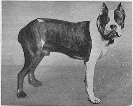
Muehlbauer's Flocki, the first Boxer ever registered in a stud book (1904)