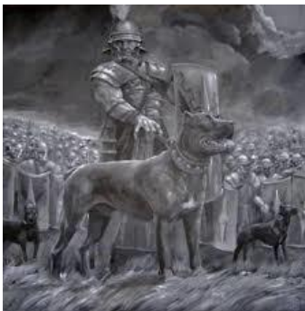
Romantische plaatjes uit de 19 e eeuw van Romeinse ‘vechthonden’ inspireerden fokkers van de Cane Corso

De combinatie groot, brede schedel, vechthond en Molosser is dus een 19 e of begin 20 ste eeuwse ‘uitvinding’. Aangezien deze kynologische visie echter hardnekkig voortleeft, is de indruk bij veel hondeneigenaars gewekt dat de huidige dogachtige honden allemaal afstammen van Romeinse vechthonden en er ook nog hetzelfde uitzien als toen.