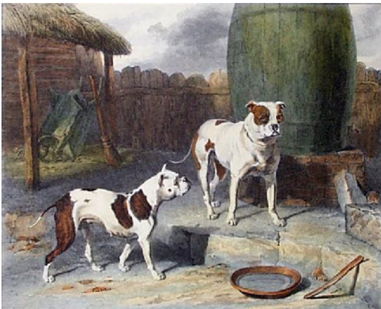
Old English bulldog. Voorbeeld voor de Amerikaanse Bulldog