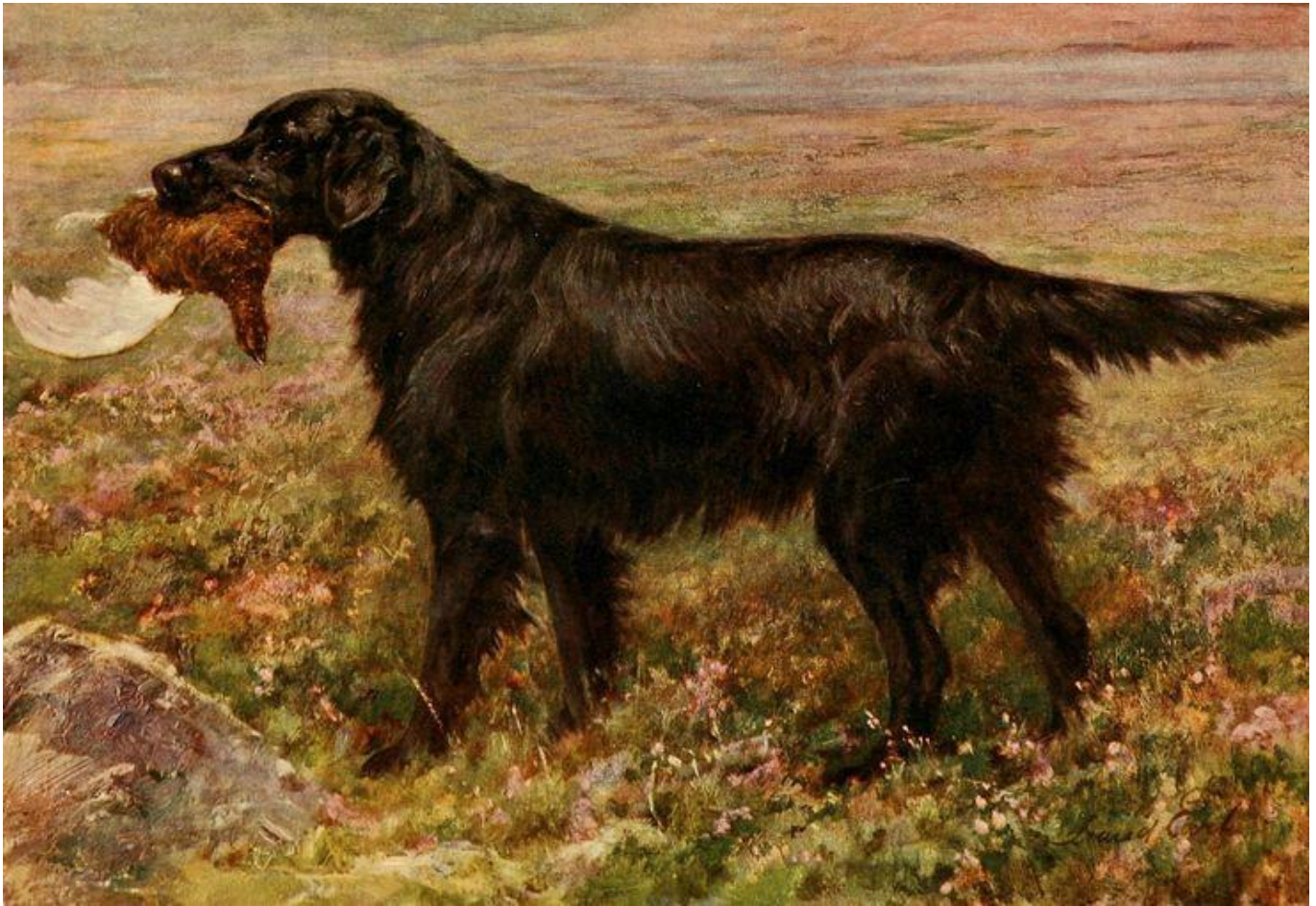
Maud Earl. Flatcoated Retriever 1911