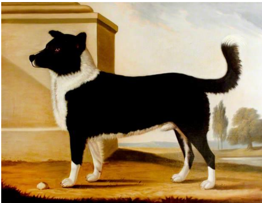
Boatswain, de Newfoundlandse hond van Loer Byron, 1808

Vaysse, Amaury et al. (2011). Identification of Genomic Regions Associated with Phenotypic Variation between Dog Breeds using Selection Mapping. PloS Genetics 7,10 , 1-21