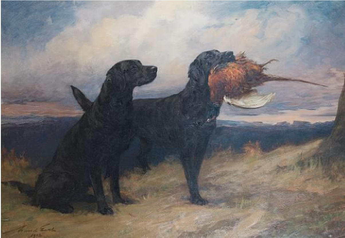
Maud Earl. Labrador Peter of Faskally rond 1912.