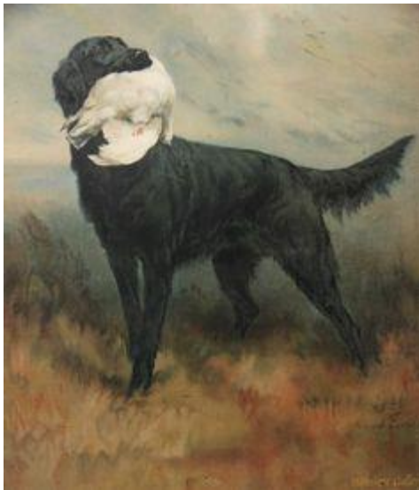
Maud Earl, Flatcoated Retriever begin 20ste eeuw