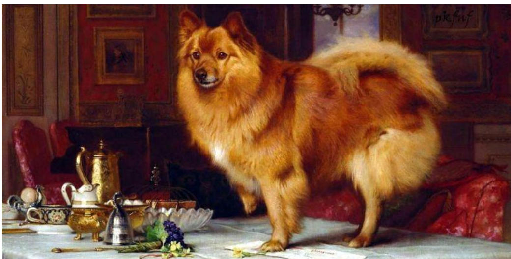
Marco on the Queen's Breakfast Table", Koningin Victoria's Italiaanse spits Marco geschilderd door Charles Burton Barber in 1893