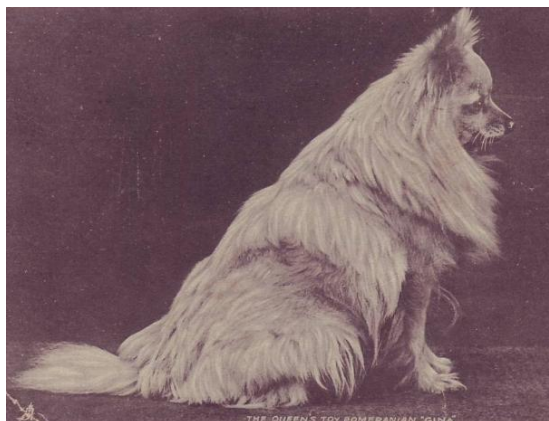
Gina, Koningin Victoria's pomeriaan rond 1890