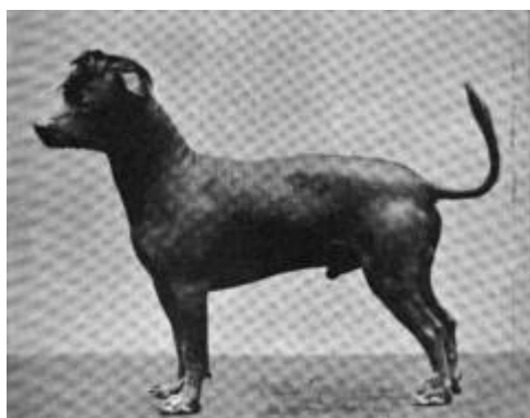
Haarloze hond rond 1900

Vilà C., Maldonado J.E., & Wayne R.K. (1999). Phylogenetic relationships, evolution, and genetic diversity of the domestic dog. Journal of Heredity 90, 1. 71-77.