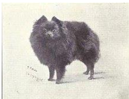
Pomeriaan rond 1915