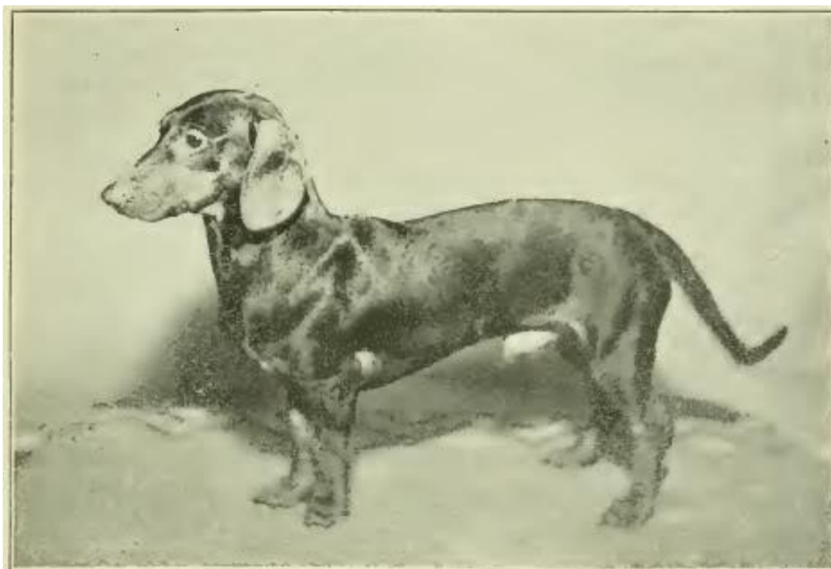
J. H. Snow's, Philadelphia, Pa. FRITZ.