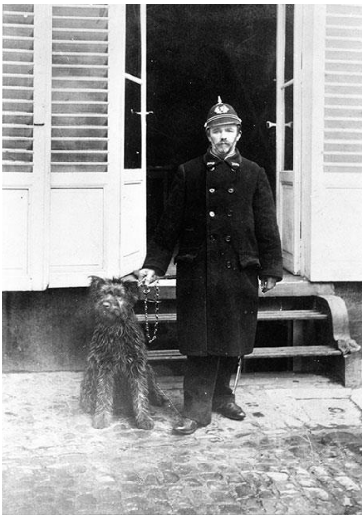
Politieagent met Bouvier-achtige hond rond 1900

http://www.genetics.org/content/179/4/2163.full.pdf