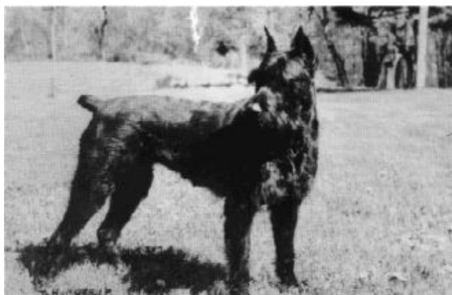
Riesenschnauzer rond 1970